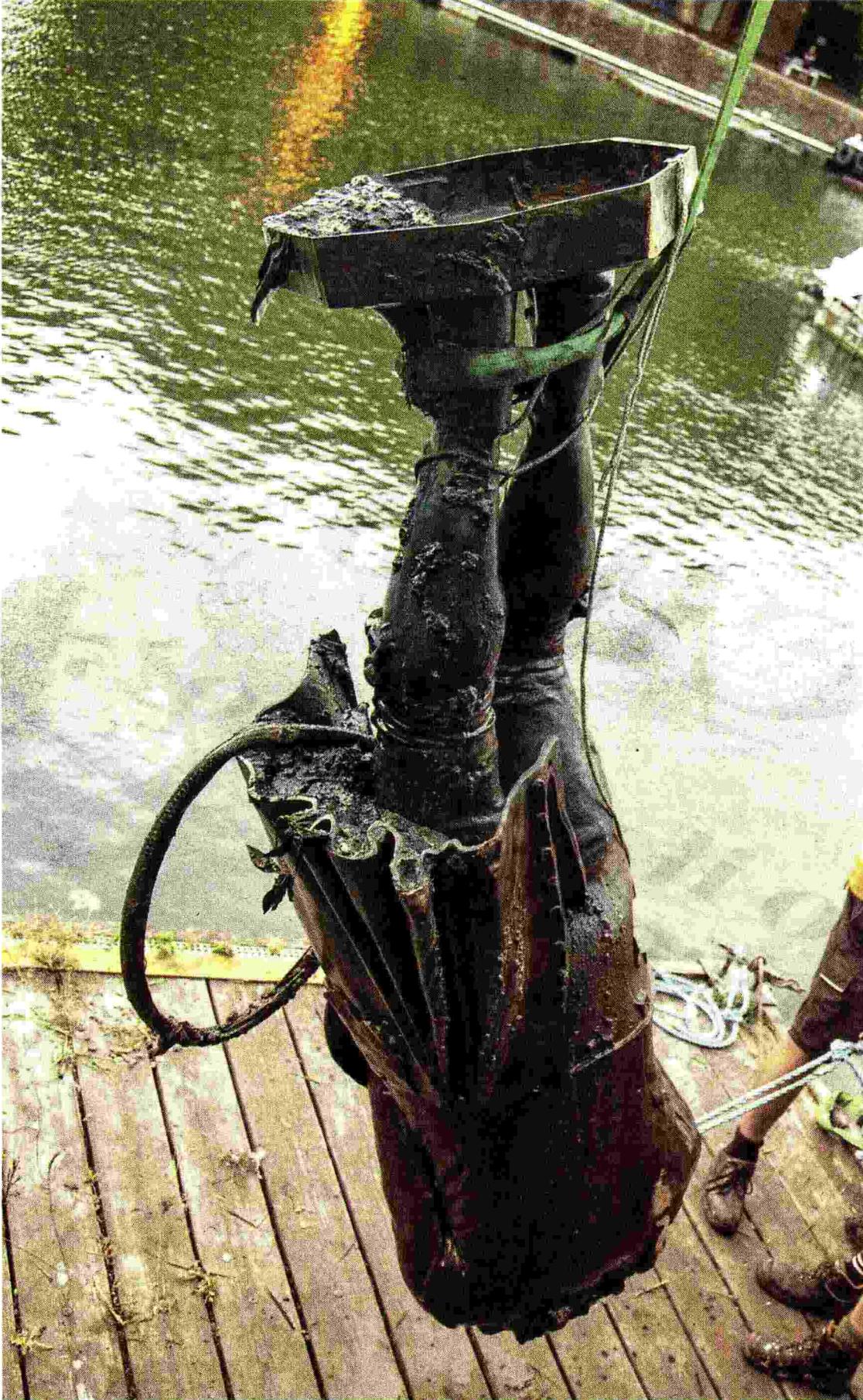
La statua di Edward Colston recuperata dal porto di Bristol: abbattuta dagli attivisti di Black Lives Matter

Ritaglio stampa ad uso esclusivo del destinatario, non riproducibile.