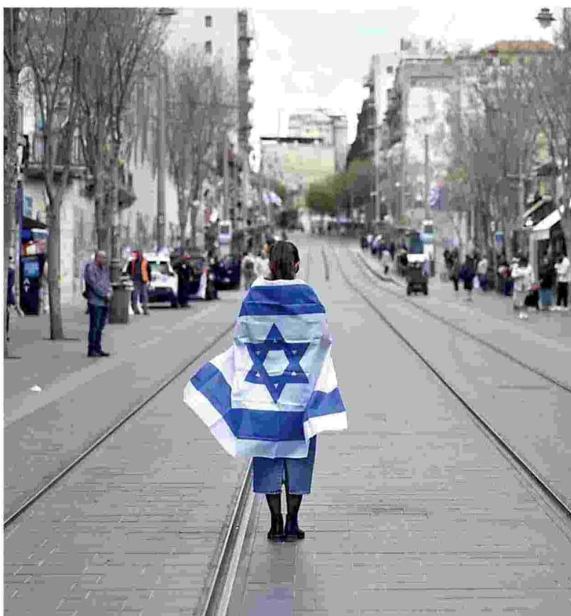
Una donna con la bandiera israeliana addosso cammina nelle strade di Gerusalemme, vuote dopo un allarme aereo, lo scorso aprile

Più che due popoli due Stati, creare confederazioni basate sull'uguaglianza