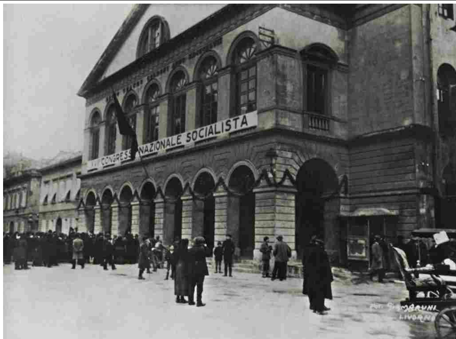
Il teatro Goldoni durante il congresso socialista, Livorno, 15 gennaio 1921.

E poi, dentro la guerra, accade l'inatteso, la rivoluzione d'ottobre che porta il più arcaico paese d'Europa, la Russia, a diventare avanguardia della rivoluzione, una rivoluzione attesa come atto finale del capitalismo in crisi e che invece si realizza là dove ancora la conta delle "anime" possedute è segno di distinzione, malgrado la servitù della gleba sia stata abolita nel 1861.