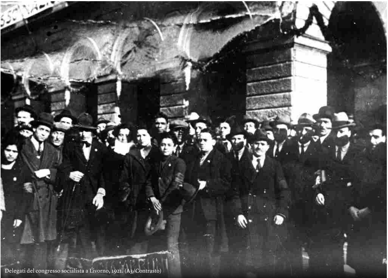
Delegati del congresso socialista a Livorno, 1921.