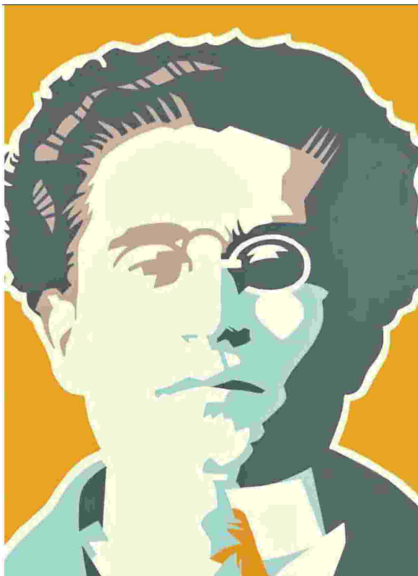
Gramsci in un disegno di Ivan Canu dalla copertina della riedizione di "Vita di Antonio Gramsci" di Giuseppe Fiori

soddisfare le esigenze e le curiosità del pubblico. Per informazioni più dettagliate e soprattutto per gli ulteriori aggiornamenti sulla situazione legata al Covid-19, si possono consultare le pagine social del museo.