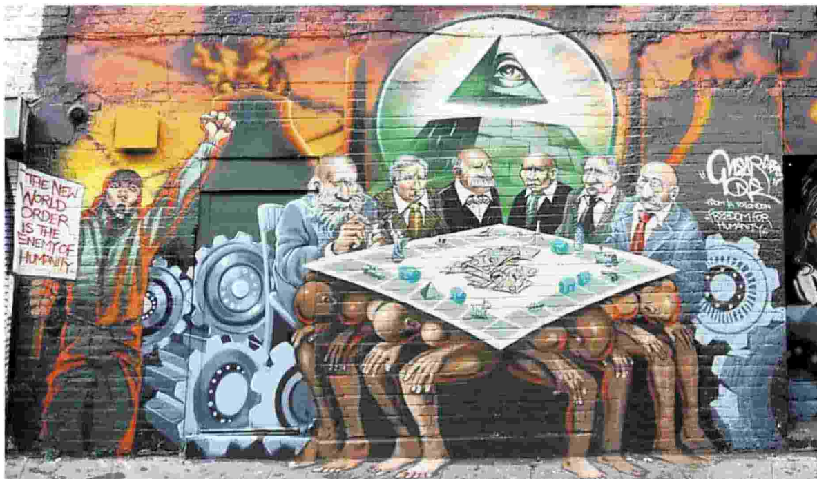
Freedom for Humanity, un murale dell'artista americano «Mear One» (Kalen Ockerman) in Hanbury Street a Londra

Il complottismo è la prosecuzione della volontà di sapere, con altri mezzi. Tutto ciò che avviene ha un perché, ma solo in pochissimi casi si individua il perché giusto