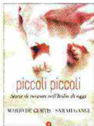
Piccoli piccoli Mario De Curtis Sarah Gangi Editori Laterza Pagine 165 Euro 16,00