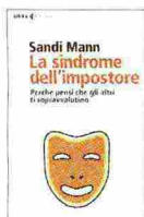
La sindrome dell'impostore Sandi Mann Feltrinelli Pagine 176 Euro 14,00