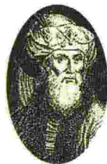
Qui sopra: lo storico Flavio Giuseppe. Nella foto in alto: una copia del corteo trionfale raffigurato sull'arco di Tito per celebrare la vittoria sugli Ebrei (Beth Hatefutsoth)