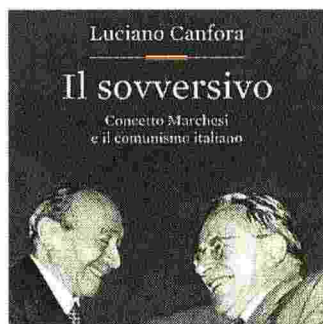
Il libro Luciano Canfora parlerà lunedì di Concetto Marchesi a partire dal suo «Il sovversivo» (Laterza, 2019)