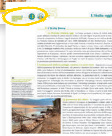
GEOGRAFIA E EDUCAZIONE CIVICA