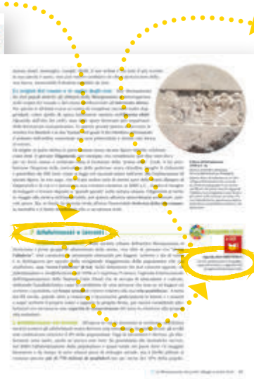
EDUCAZIONE CIVICA / GEOGRAFIA