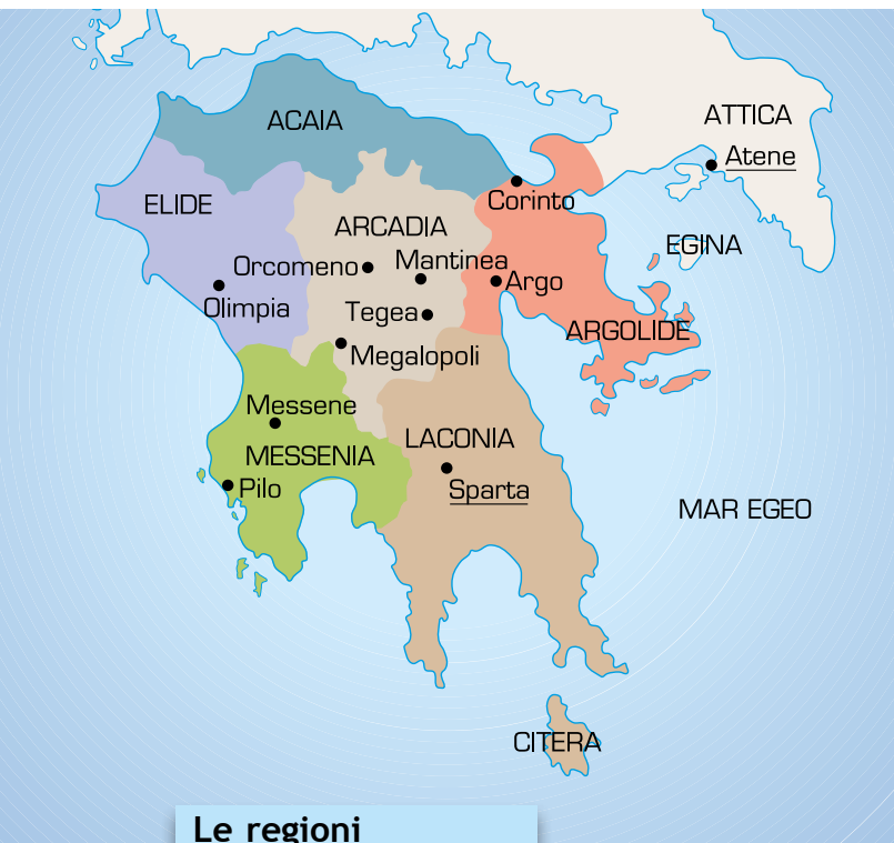
Le regioni del Peloponneso