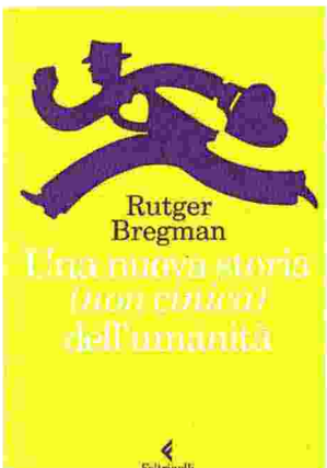
• Una nuova storia (non cinica)...