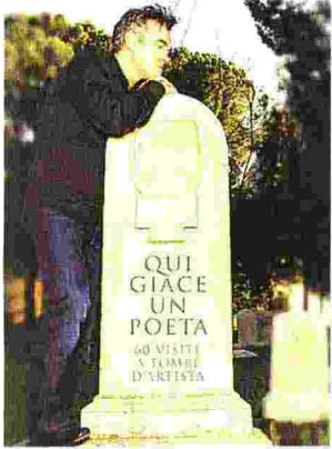
• Qui giace un poeta

• Il calendario insolito La nostra storia giorno per giorno, dall'antichità fino a "ieri", al XX secolo