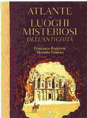
• Atlante dei luoghi misteriosi...