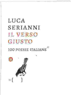
• Il verso giusto