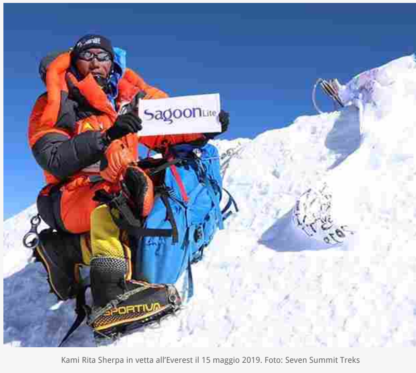
Kami Rita Sherpa in vetta all'Everest il 15 maggio 2019.

"Nel libro racconto la storia e il lavoro delle guide occidentali che accompagnano ogni anno i loro clienti verso la cima. E quello delle grandi guide nepalesi come Kami Rita Sherpa, che da ragazzo avrebbe voluto diventare un monaco buddhista, e che invece è arrivato per 24 volte sull'Everest", spiega l'autore.