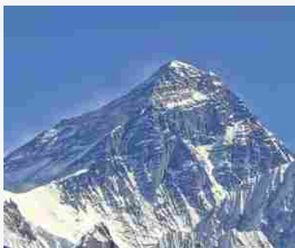
Everest fotografato dal Gokyo Ri, Khumbu, versante Sud-Ovest, Nepal.