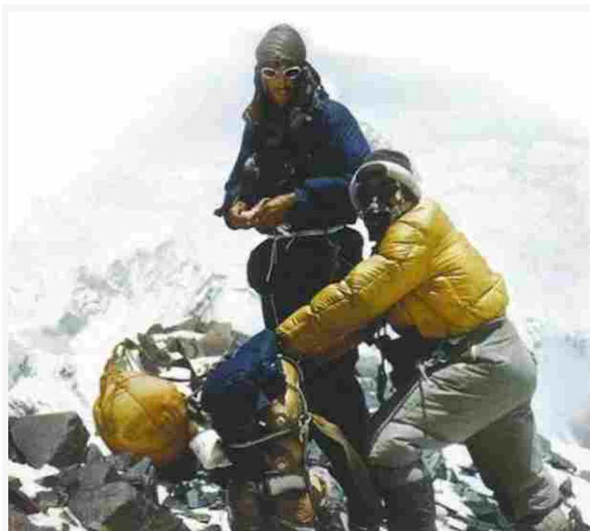
Edmund Hillary e Tenzing Norgay, Colle Sud, 29 maggio 1953.

Contrastano con queste vittorie la scomparsa a 8500 metri di quota degli inglesi Mallory e Irvine nel 1924, le 10 vittime del 1990 quando una bufera ha investito due spedizioni a poca distanza dalla cima. E le 15 vittime causate, nell'aprile del 2015, da una valanga staccata dal terremoto che quel giorno ha sconvolto il Nepal.