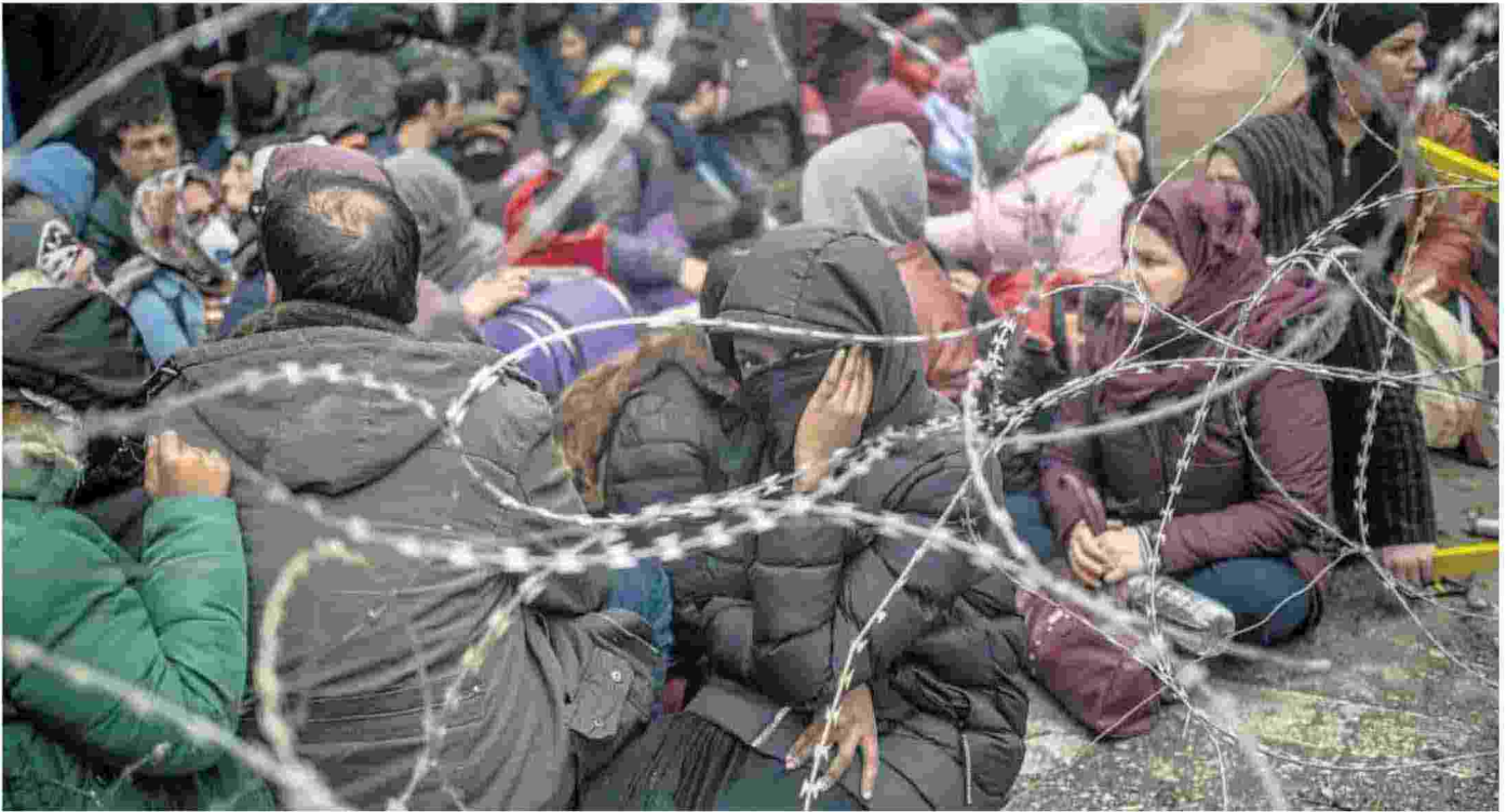
Profughi siriani al confine tra Turchia e Grecia