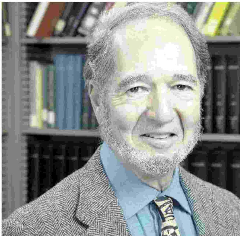
DIAMOND Il Premio Pulitzer inaugurerà il ciclo di confronti virtuali del festival vicino/lontano che si trasferisce sul web