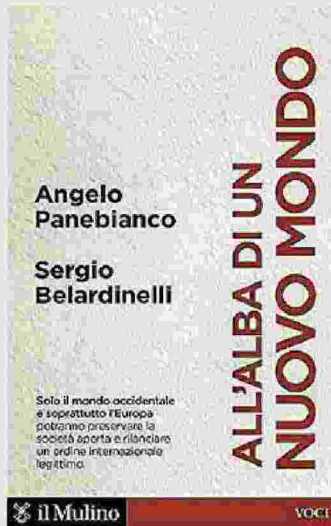
Angelo Panebianco Sergio Belardinelli All'alba di un mondo nuovo IL MULINO