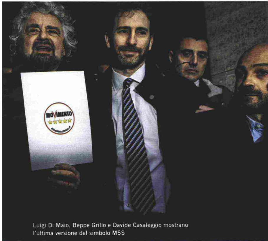
Luigi Di Maio, Beppe Grillo e Davide Casaleggio mostrano l'ultima versione del simbolo M5S

que Stelle, e la supposta vena «di sinistra» dei grillini, per capire a che latitudine si muovano davvero conflitti e convergenze soccorre l'interpretazione offerta da Jacopo Iacoboni, cronista della Stampa, nel suo libro "L'Esecuzione" (è in uscita il 28 marzo), che ricostruisce le radici sovraniste del movimento più liquido e frainteso d'Italia, adesso impegnato in un braccio di ferro con la Lega che, lungi da essere una manifestazione di diversità, è «una lotta per la supremazia, perché i due partiti si contendono e roscchiano lo stesso campo elettorale».