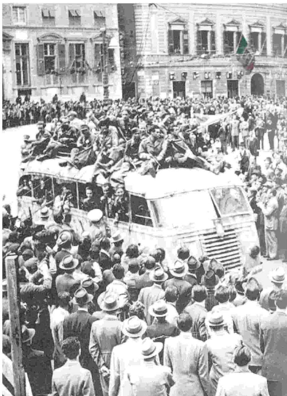
Partigiani in festa in Piazza De Ferrari a Genova il 25 aprile 1945