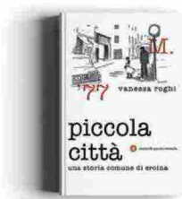
Vanessa Roghi Piccola città. Una storia comune di eroina Laterza ★★★★★

feeling tra gli italiani e le pere, l'emergenza degli anni '70, la French Connection che si prende la Maremma, l'Aids. E poi tanta politica, i danni che la sostanza arrecò al Movimento, di cui il padre dell'autrice faceva parte. Un libro fondamentale, soprattutto oggi che l'eroina è tornata inquietantemente di moda e il dibattito pubblico sul tema dimostra che siamo pronti a ripercorrere tutti quanti i fatali errori del passato. Ⓜ