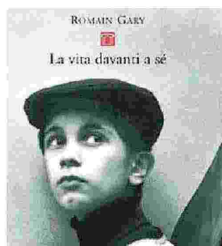
La commovente storia di Momo nel romanzo di Romain Gary