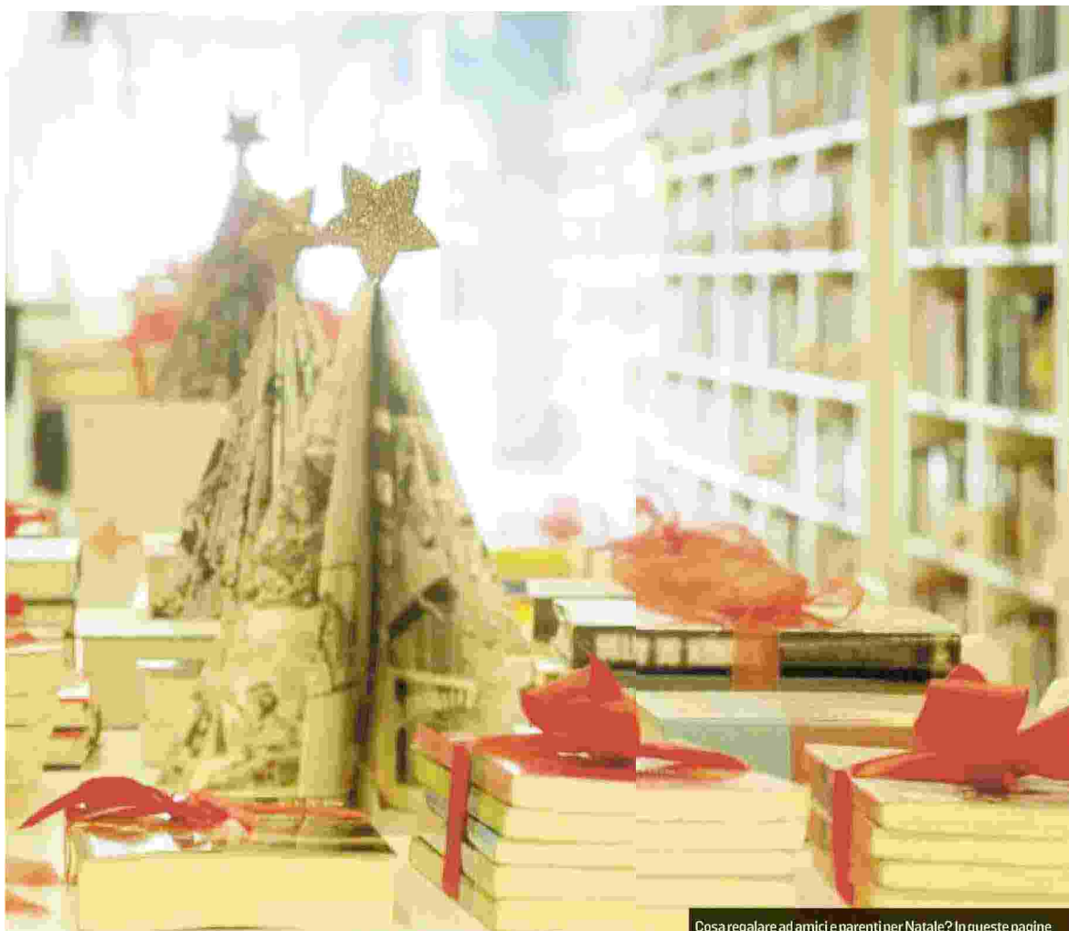
Cosa regalare ad amici e parenti per Natale? In queste pagine qualche suggerimento per orientarsi nella scelta in libreria

mezzo di trasporto ma uno strumento di conoscenza di sé e di ciò che ci circonda, un'alternativa sana e divertente alla macchina. Infine, per orientarci nella scelta del prossimo libro partiamo dall' Incipit. 2001 modi per iniziare un romanzo di Giacomo Papi, Federica Presutti e Riccardo Renzi (Skira, 589 pagine). Incipit celebri e curiosi della narrativa più conosciute al mondo. Con introduzione di Umberto Eco. —