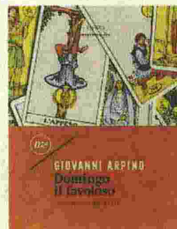
Domingo il favoloso | Giovanni Arpino | minimum fax | 228 pagine | 15 euro

lingua irregolare e fantasiosa Arpino offre il suo omaggio più riuscito al genere fantastico e compone una favola misteriosa come una mappa dei segni incisi su una mano. Appassionata postfazione di Darwin Pastorin.