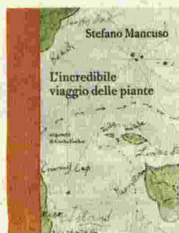
L'incredibile viaggio delle piante | Stefano Mancuso | Laterza | 151 p. | 18 euro

pionieri, fuggitivi, reduci, combattenti, eremiti, signori del tempo. Come gli hibakujumoku, alberi rispettati e tutelati, sopravvissuti alla bomba atomica ad Hiroshima. Simbolo vivente e tangibile della follia della guerra.