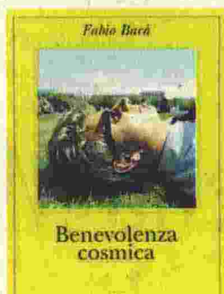
Benevolenza cosmica | Fabio Bacà | Adelphi | 225 pagine | 18 euro

scritto con ritmo e buoni dialoghi, costruito in una sorta di crescendo e piccole sorprese che spingono il lettore a voler vedere dove tutto va a parare, grazie anche a una lingua veloce e incisiva. Romanzo d'esordio da sottolineare.