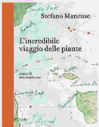
Stefano Mancuso L'INCREDIBILE VIAGGIO DELLE PIANTE Laterza, 144 pag. ill., 18 euro

L'autore – direttore del Laboratorio internazionale di neurobiologia vegetale (Linv) – racconta come le piante sono state capaci – pioniere, fuggitive, eremite, indomite – di crescere nei luoghi più inospitali, come si sono sviluppate su isole non adatte alla vita, come riescono a viaggiare nel tempo. Sono solo alcune delle incredibili storie raccolte in questo libro, illustrato dagli acquerelli di Grisha Fischer.