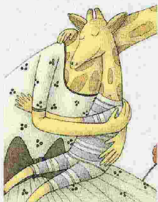
Si può dire senza voce di Armando Quintero Glifo editore. Pagine 32, 15 €

Dei tenerissimi animali sono pronti a dimostrare ai bambini che ci si può dire "ti voglio bene" col semplice linguaggio dei sorrisi, degli abbracci e delle carezze. Una giraffina, prima di tutti gli altri. Lei, che non ha voce, è abituata a donare il proprio affetto con le carezze e gli abbracci, glielo ha insegnato la mamma. Il libro dimostra come il contatto fisico sia imprescindibile per lo sviluppo emozionale dei più piccoli. Dai tre anni.