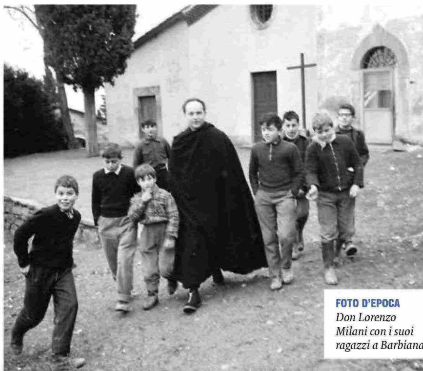
FOTO D'EPOCA Don Lorenzo Milani con i suoi ragazzi a Barbiana.

Mica facile: di don Milani sembra che si sia già detto tutto , che i decenni che ci separano da lui, diradando per ragioni anagrafiche le testimonianze dirette, finiscano per distanziarci irrimediabilmente dal priore di Barbiana. Ma Affinati, con la sua voglia di cercare, con il suo sguardo acuto e con la capacità tutta particolare di dar voce ai dettagli, ci lascia la sensazione che il distacco della storia faccia bene alla