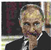
Mosca Vladimir Putin, 62 anni, presidente della Russia ed ex primo ministro