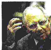
Berlino Wolfgang Schäuble, 72 anni, ministro delle Finanze tedesco

I greci hanno mostrato una sbruffoneria che ha mal disposto i negoziatori