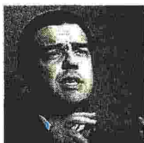
Atene Alexis Tsipras, 40 anni, è il leader del partito di sinistra Syriza e premier greco

Isolare la Russia è un danno. Il problema è avere chiara l'idea di dove devi arrivare