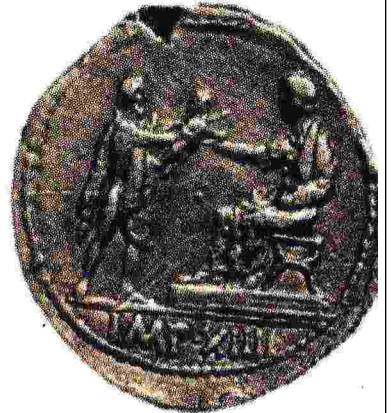
LE IMMAGINI L'imperatore Cesare Ottaviano Augusto sopra effigiato in due monete