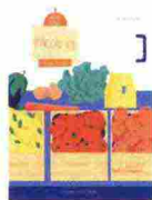
Michela Fantini Faccio io Illustrazioni di Giulio Castagnaro Armando Curcio Editore (Curcio kids), pp. 61, 12,90 euro, dagli 8 anni

● Sempre più programmi televisivi coinvolgono bambini e ragazzi in gare di cucina, e spesso "impastocchiare" è una delle attività che si svolgono nelle scuole, specialmente in quelle dell'infanzia. Ecco allora che certe passioni possono nascere fin da giovanissimi, ed essere accompagnate da un libro come questo, utile per orientare alla scelta biologica ed ecocompatibile