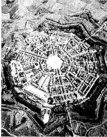
CITTÀ IDEALE Palmanova in Friuli. Sopra la moderna città di Shanghai