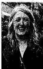
L'esperta Mary Beard è una storica dell'arte